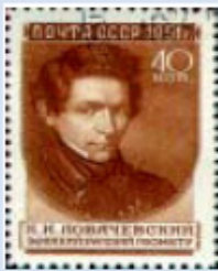
PIERRE SIMON LAPLACE