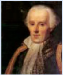
NIKOLAI I. LOBACHEVSKY