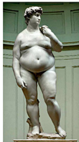
Es un factor determinante de cuadros de depresión.